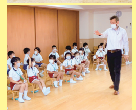
茶道、体操、中学生と交流、英語など