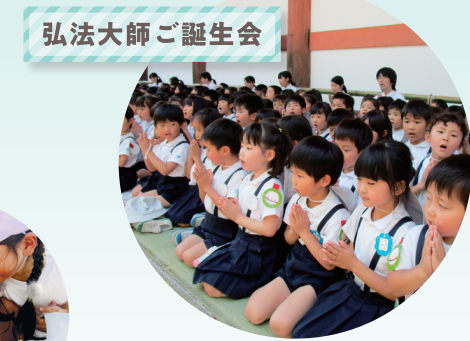
弘法大師ご誕生会